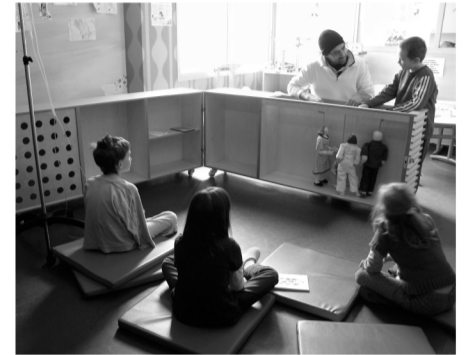
Mon Unité Mobile, Perpinyà 2008