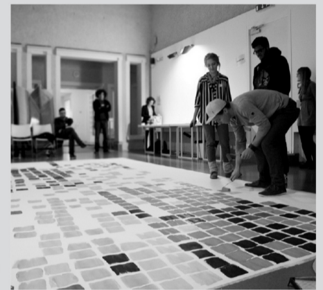
Project DIY, Tate Gallery St Ives