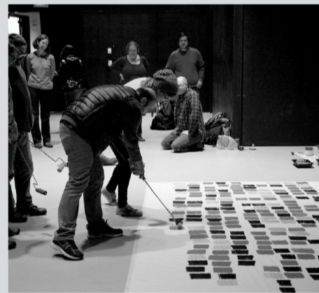
Project DIY, Maine USA