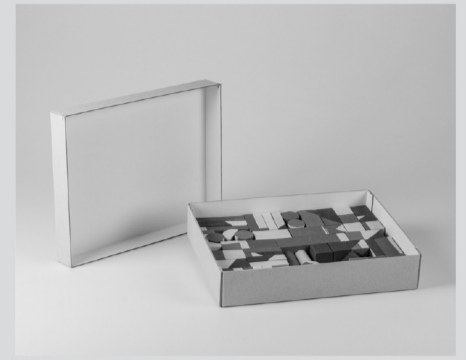
Peça de Sió Pardo